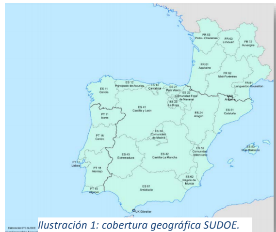
Ilustración 1: cobertura geográfica SUDOE.

Dirigido a: Todas las entidades públicas, privadas con o sin ánimo de lucro y empresas (a excepción de la gran empresa) localizadas en la zona elegible del programa Sudoeste.